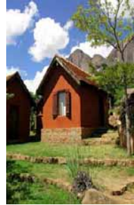
Hütte mit / ohne- Sanitär – Standard